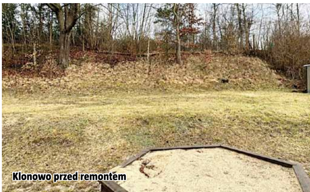
Klonowo przed remontem

Trwa realizacja tegorocznego budżetu inwestycyjnego. Teraz czas na drogi i chodniki.