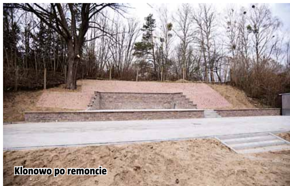
Klonowo po remoncie

użytkowników o organizacji ruchu w danym miejscu i służą zwiększeniu bezpieczeństwa. Dlatego warto, aby były dobrze widoczne. Od kilku dni trwa malowanie pasów w naszym mieście.